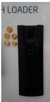
Εικόνα 4: Σχισμή εισαγωγής νομισμάτων στο μηχάνημα πίστωσης.

Τα χαρτονομίσματα εισάγονται στο μηχάνημα πίστωσης από την σχισμή που δεικνύεται από τα λαμπάκια. Σε αντίστοιχη σχισμή στα δεξιά (Εικόνα 4), μπορεί να γίνει εισαγωγή νομισμάτων.