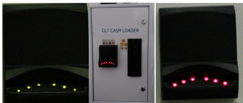
Εικόνα 3: Το μηχάνημα πίστωσης και λεπτομέρειες αυτού.

Ταυτόχρονα στην οθόνη του μηχανήματος πίστωσης θα παρουσιαστούν τα στοιχεία σας, όπως επίσης και το υπόλοιπο σας.